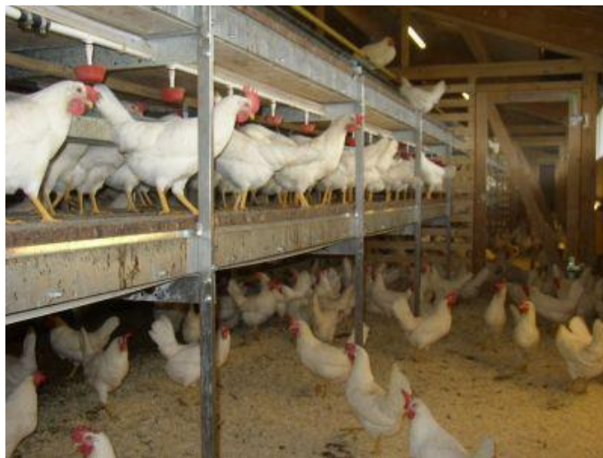
zdjęcie: pogładowe zdjęcie poziomego systemu chowu kur niosek

W celu dotrzymania zapisów rozporządzenia komis (WE) nr 889/2008 każdy obiekt wyposażony będzie w trwałe przegrody, tak aby skutecznie odseparować poszczególne pomieszczenia (kurniki) między sobą, aby ilość 3000 szt. kur niosek w każdym nie została przekroczona (3000 szt. : 6szt/1m 2 = 500 m 2 powierzchni do chowu).