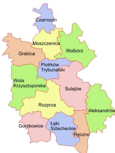
Rysunek 1. Gmina Rozprza na tle powiatu piotrkowskiego

Gmina Rozprza zajmuje obszar 163,08 km 2 . Według danych GUS z końca 2017 roku Gmina liczy 12.306 mieszkańców, a gęstość zaludnienia to w przybliżeniu 75 osoby/km 2 . Gmina Rozprza leży w środkowej części powiatu piotrkowskiego. Bezpośrednio graniczy z następującymi jednostkami: Gorzkowice, Kamieńsk, Łęki Szlacheckie, Piotrków Trybunalski, Ręczno, Sulejów, Wola Krzysztoporska.